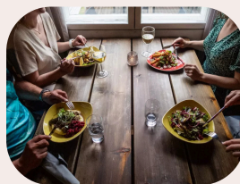
Traditionelle Köstlichkeiten beim Wildnis-Dinner