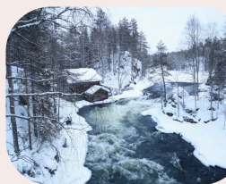
Zeit zur freien Verfügung und Erkundung der Gegend