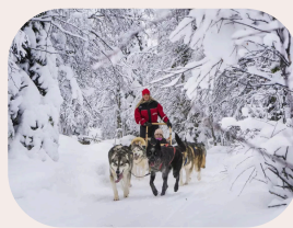
Husky-Safari durch die Winterlandschaft