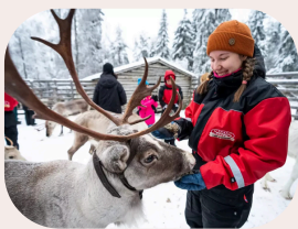
Besuch einer Rentierfarm mit Schlittenfahrt