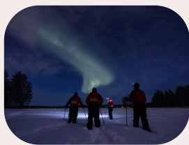
Aurora Schneeschuhtour bei Dunkelheit