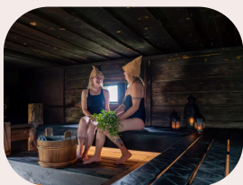
Entspannen beim Sauna-Event