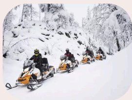
Schneemobil-Tour mit Kaffee-/Tee-Pause